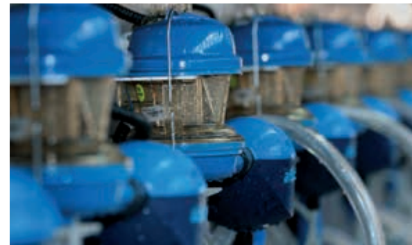
Lattometri elettronici con Afilab Electronic milkmeters with Afilab

TDM milking systems are equipped and controlled by Afimilk computerized dairy management systems. Through the computerization of your milking parlour you will be able to constantly monitor the cow heat detection, production and their health. All info registered are collected and elaborated by Afifarm software.