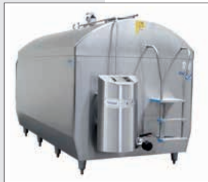
Vasche di refrigerazione del latte di varie tipologie Different size milk cooling tanks