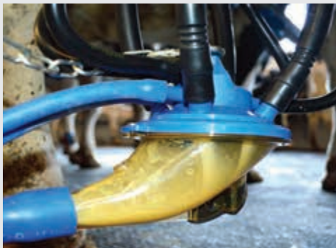
Gruppo di mungitura ConanS per flussi di latte elevati (Brevetto TDM) High flow ConanS Cluster (TDM patent)

Gli impianti di mungitura TDM sono equipaggiati e controllati dai sistemi di gestione Afimilk. Grazie all'informatizzazione sarete in grado di monitorare costantemente i calori delle bovine insieme con la loro produzione ed il loro stato di salute. Tutte le informazioni vengono raccolte ed elaborate dal software Afifarm.